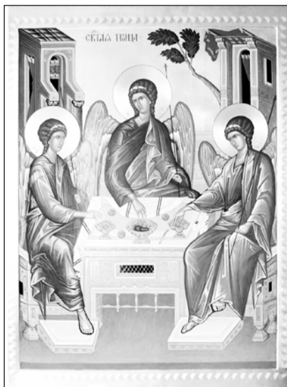
Троица. Сийская иконописная мастерская.

Накануне дня Святой Троицы мы все молимся об усопших, испрашивая им у Бога милости, прощения грехов и вечного блаженства. Этот день — праздник единства Церкви земной и Церкви Небесной.