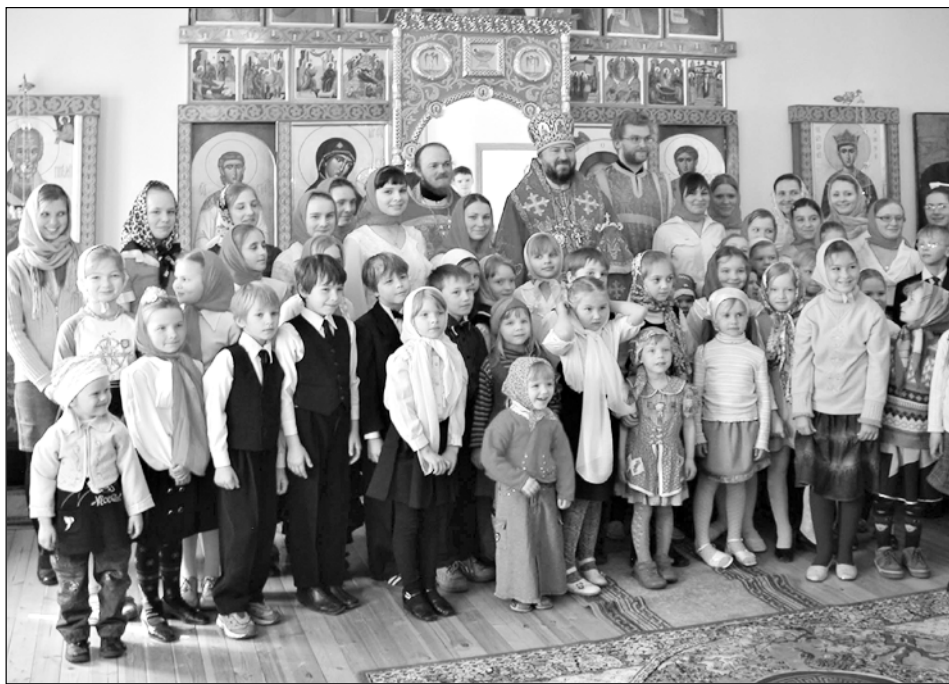
фото иерод. ф.офила.