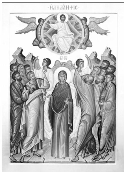
Вознесение. Сийская иконописная мастерская.

24 мая — равноапостольных Мефодия († 885 г.) и Кирилла († 869 г.), учителей Словенских.